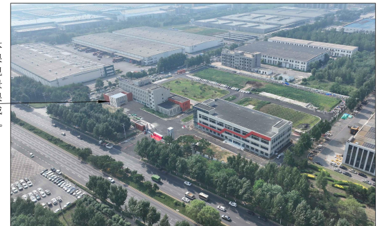
5#，本张效果图为现场实景与效果图合成图片。