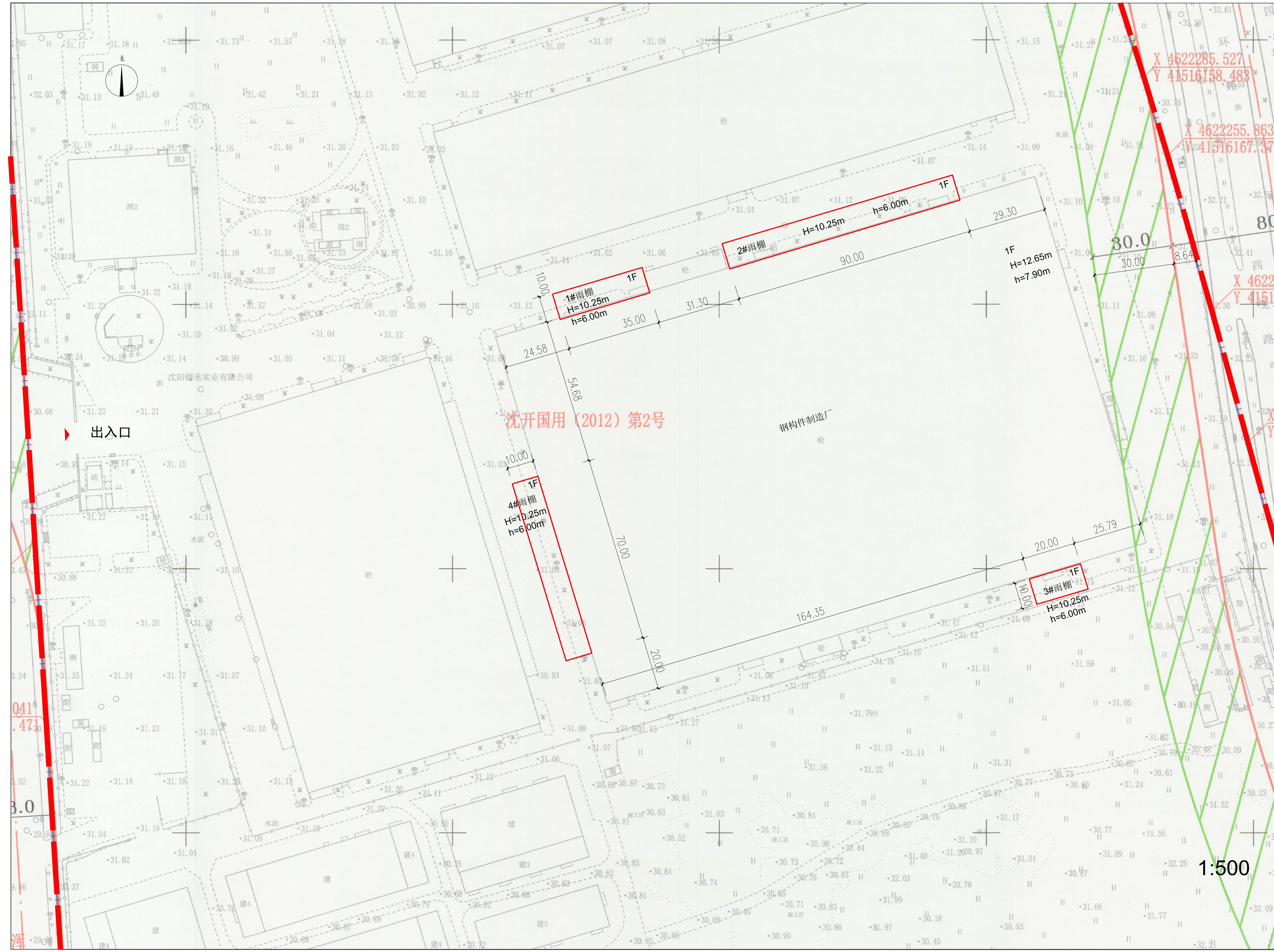
建设工程规划许可证附图