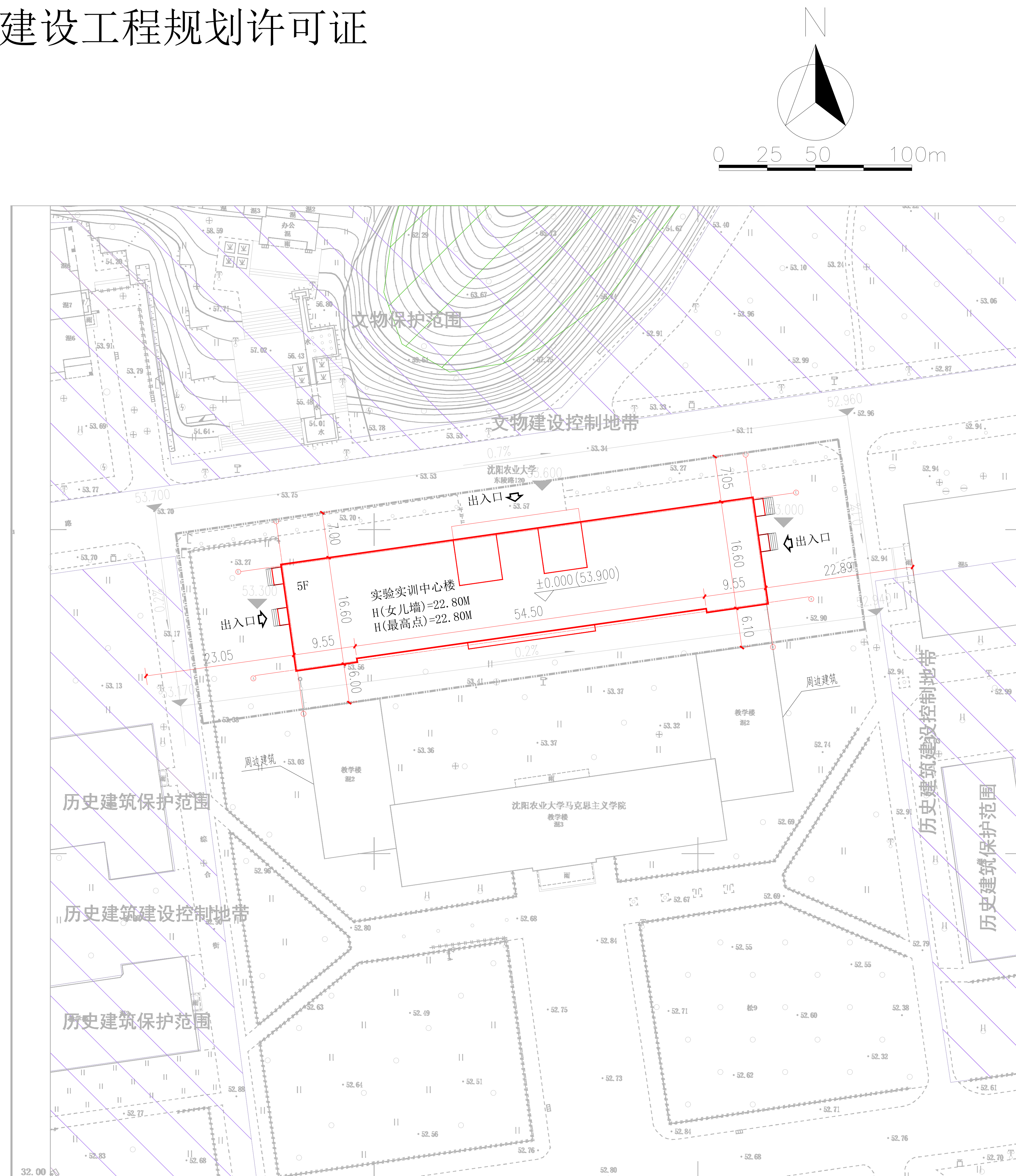
沈阳农业大学畜禽智慧养殖产教融合实训基地项目—实验实训中心楼