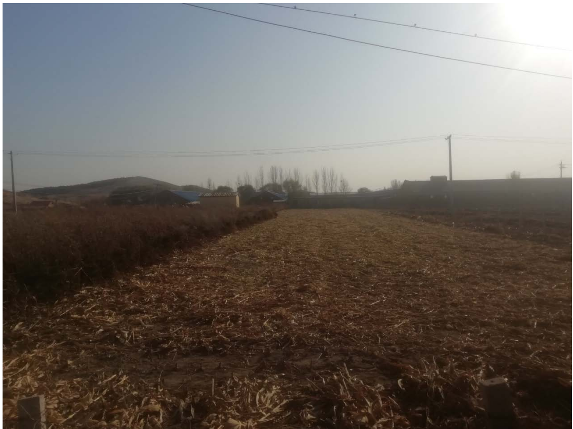
图 3-2 井房