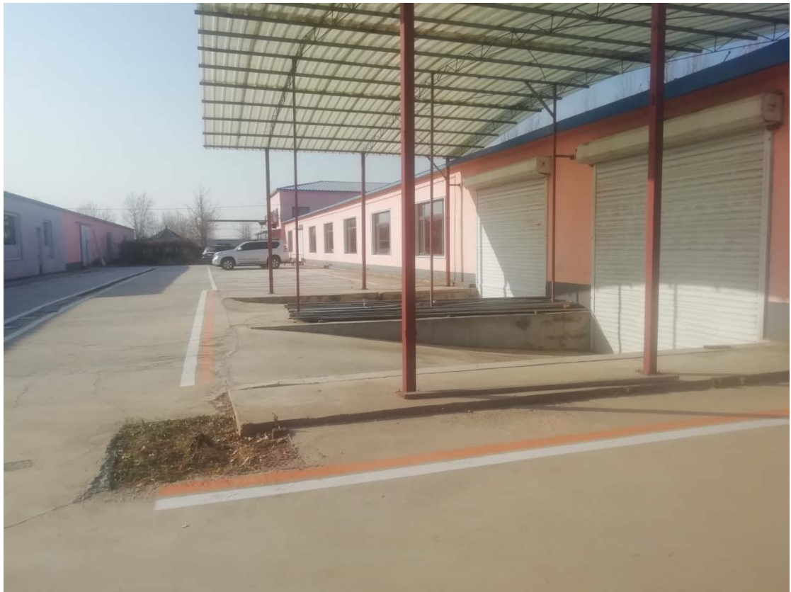
图 3-1 水厂