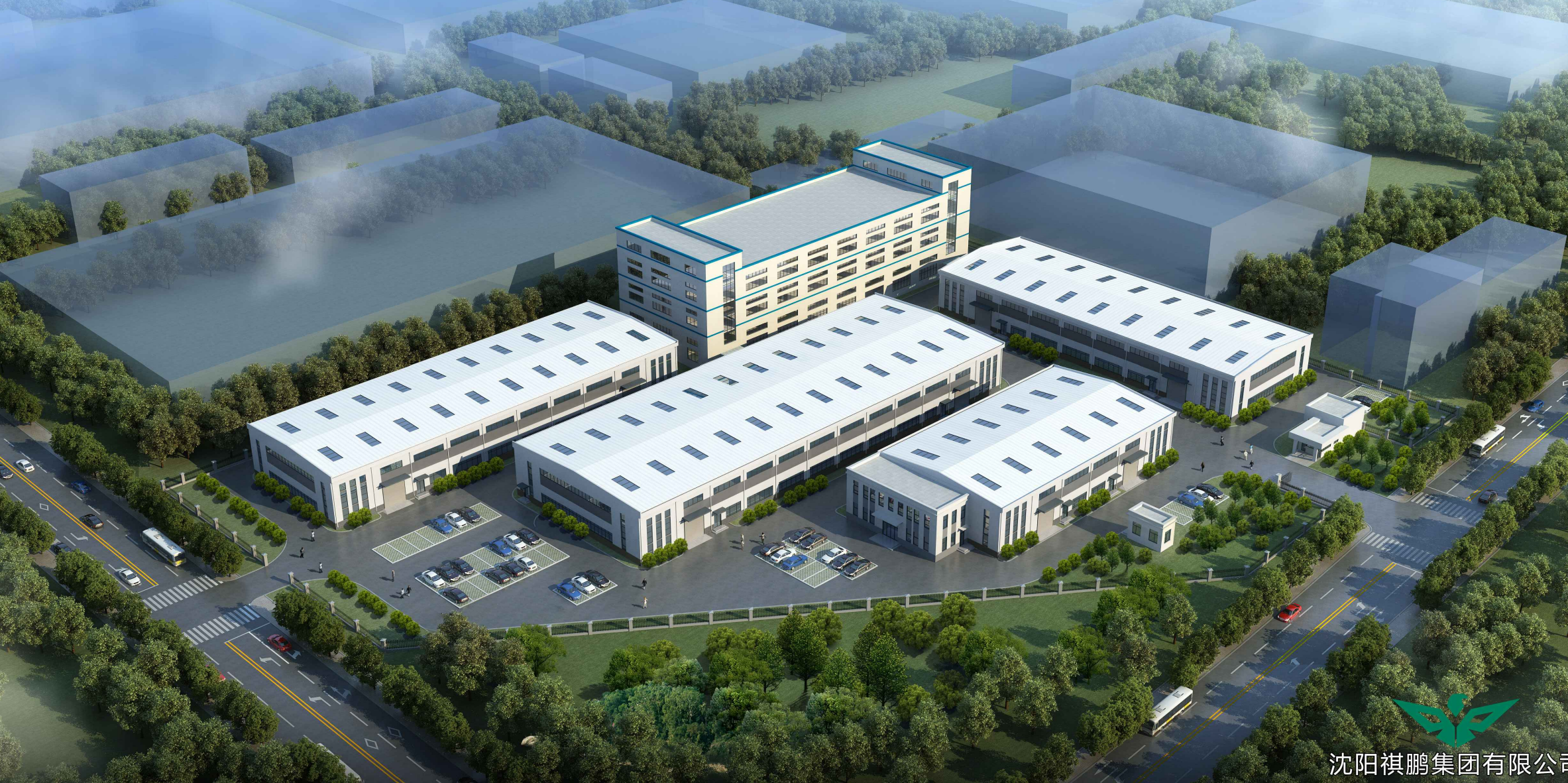
辽宁现代建设工程有限公司改扩建厂房项目——鸟瞰图