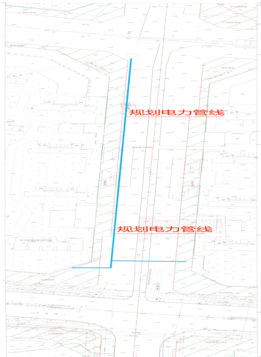
电力管线规划方案总平面图