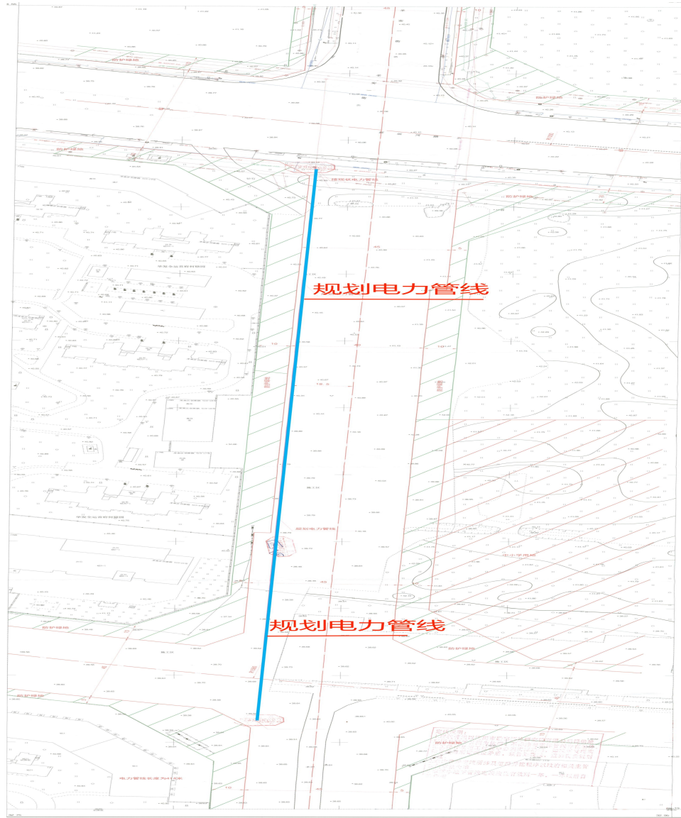
电力管线规划方案总平面图