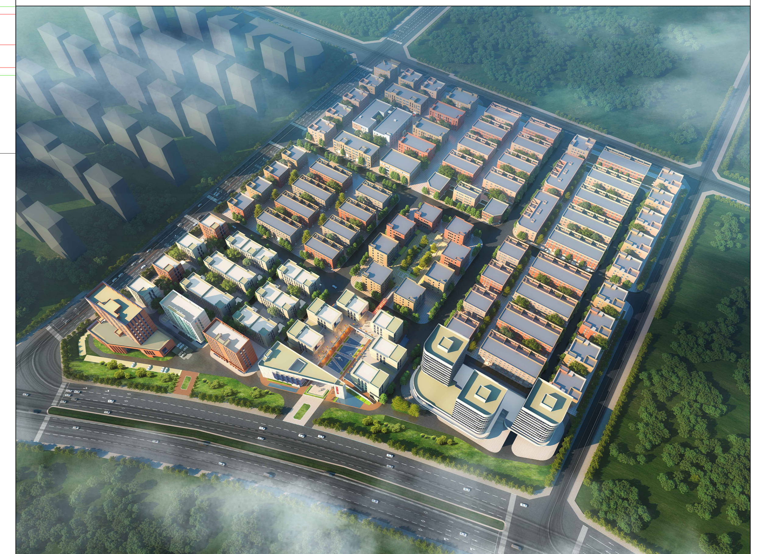
鸟瞰图(变更前后无变化)