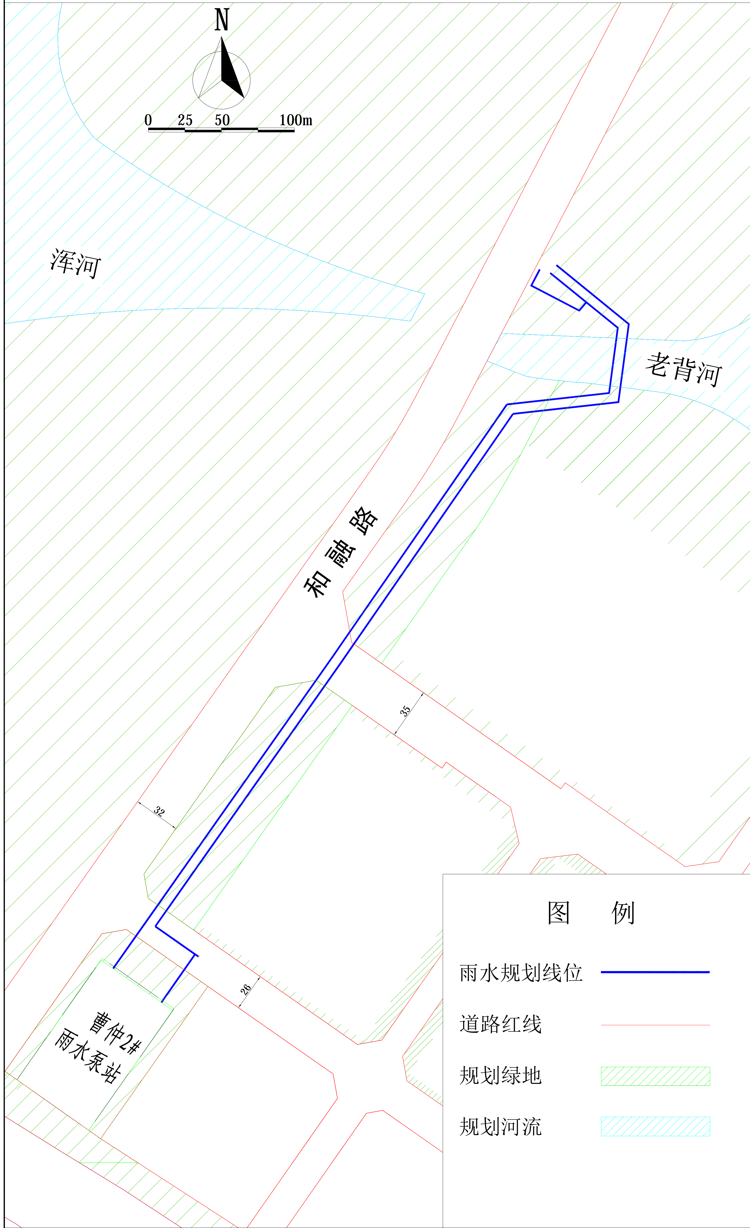
原规划设计方案总平面图