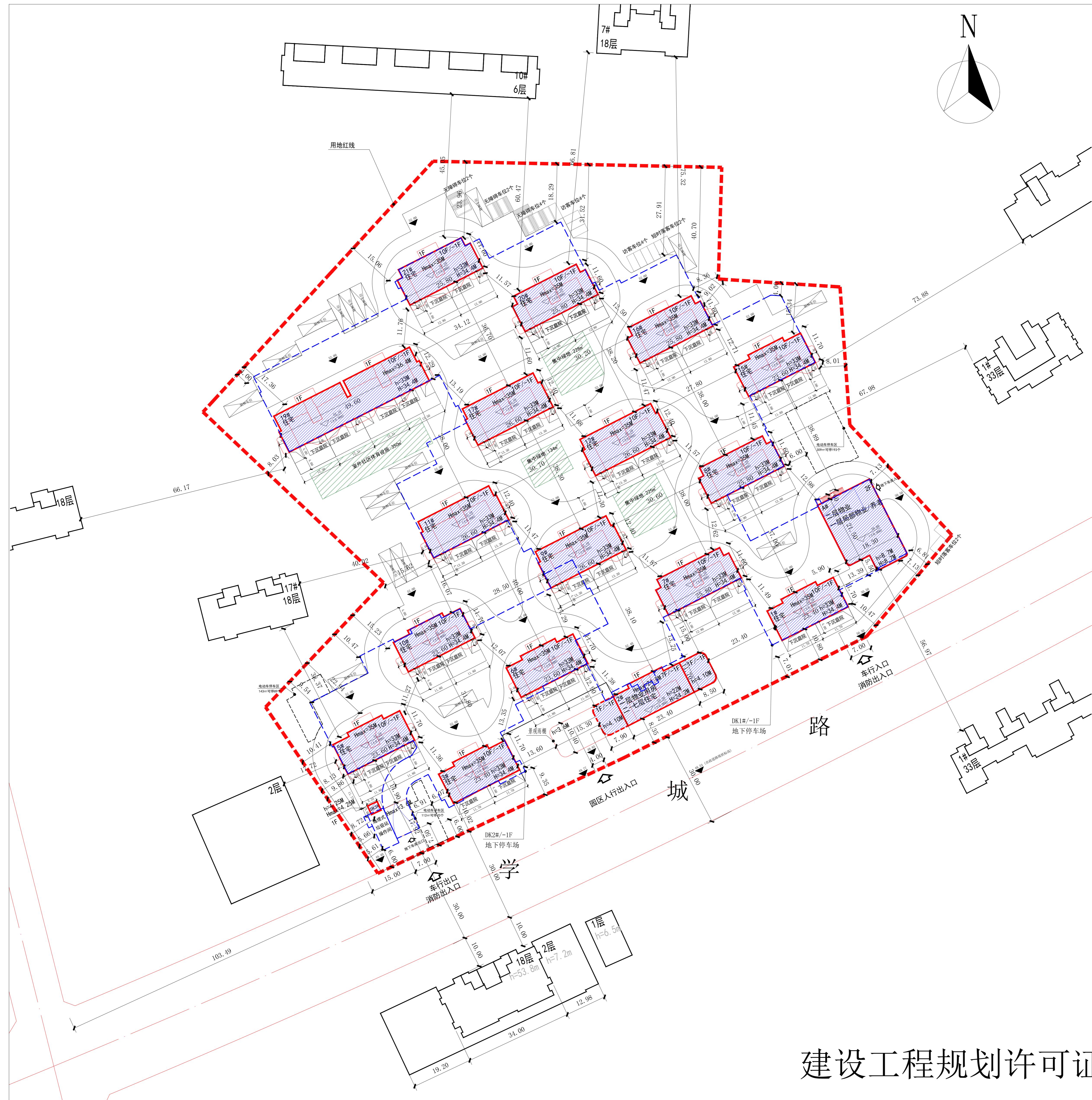
建设工程规划许可证附图