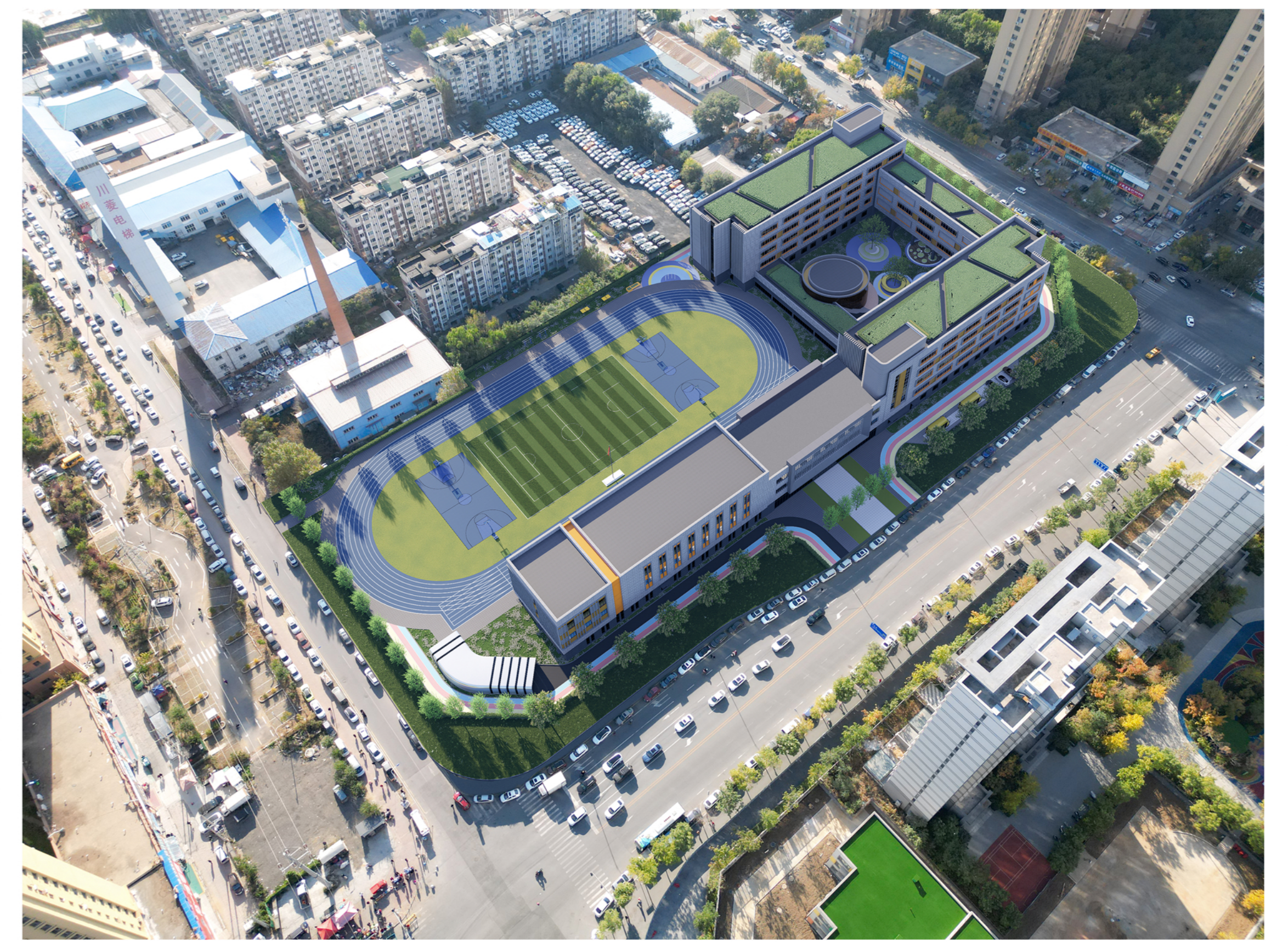
图上未标楼层为1层