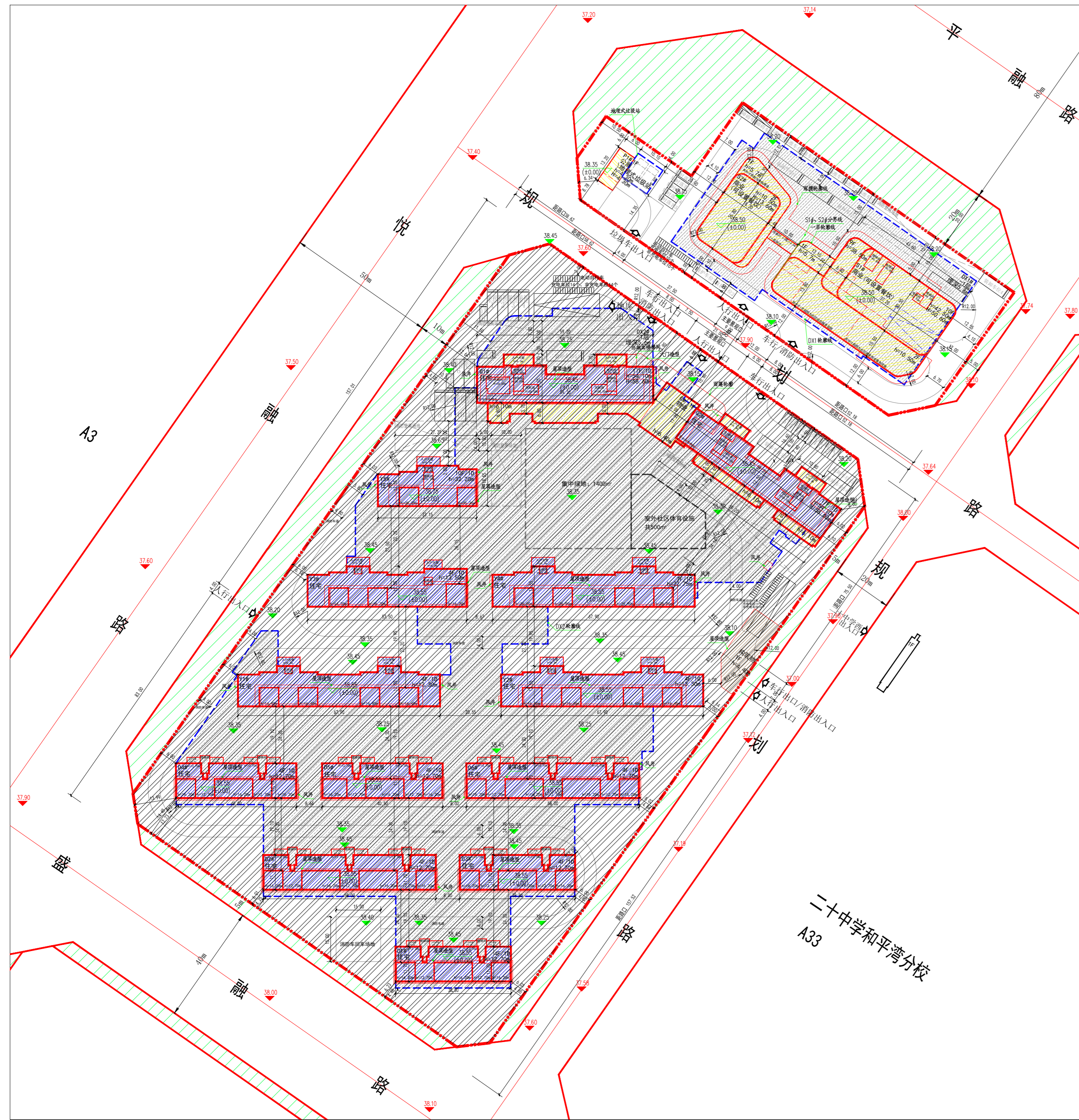
01地块变更前总平面图