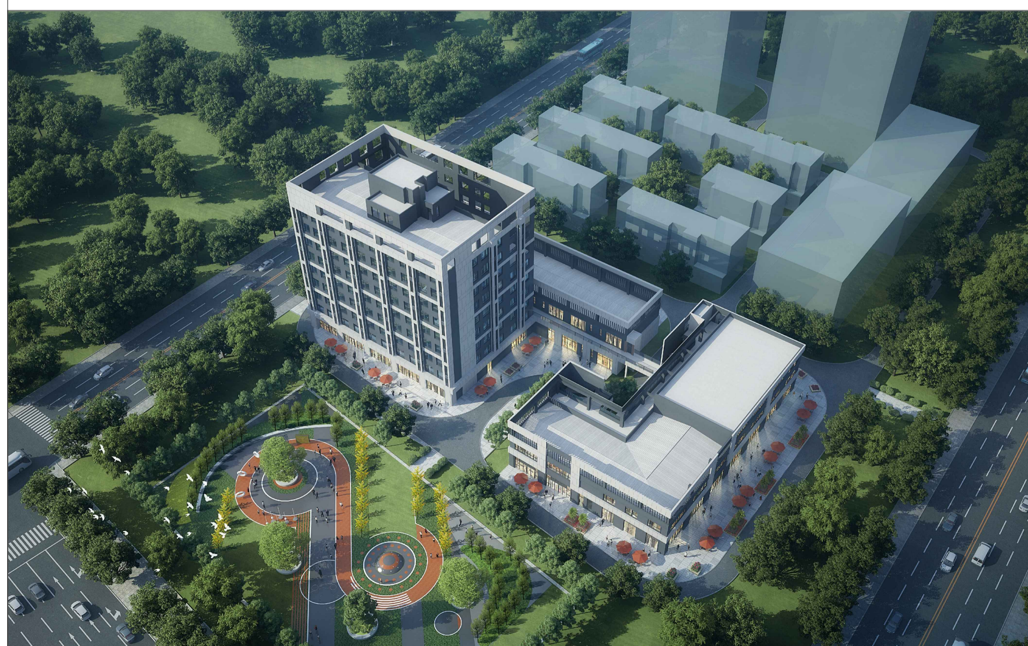
主要经济技术指标