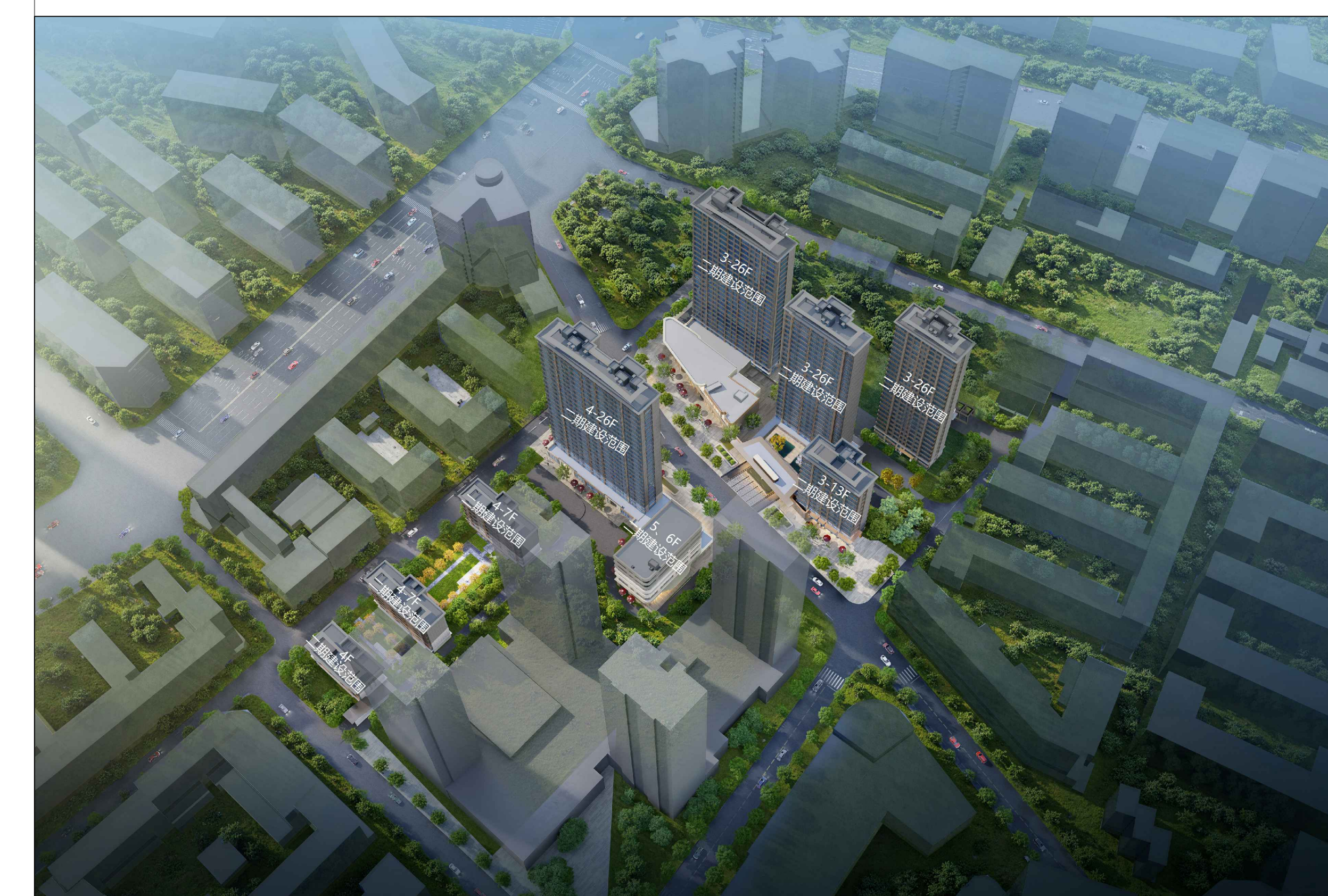
建设项目经济技术指标统计表